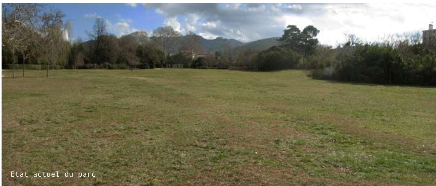
Etat actuel du parc