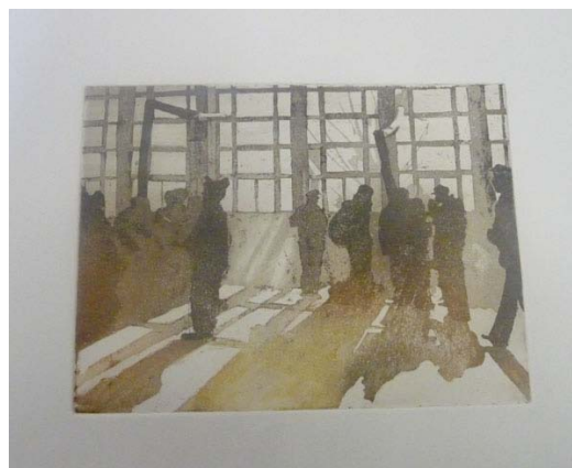
Aquarelle de Jacqueline Devylder

Plus profondément, l'adhésion est souvent implication dans un réseau actif d'échanges, de formations mutuelles, de recherches, de créations (1), pourvoyeur de lien social, de solidarité, de travail d'équipe... En outre, elle est importante pour l'association, forte de la richesse de tous ses membres.