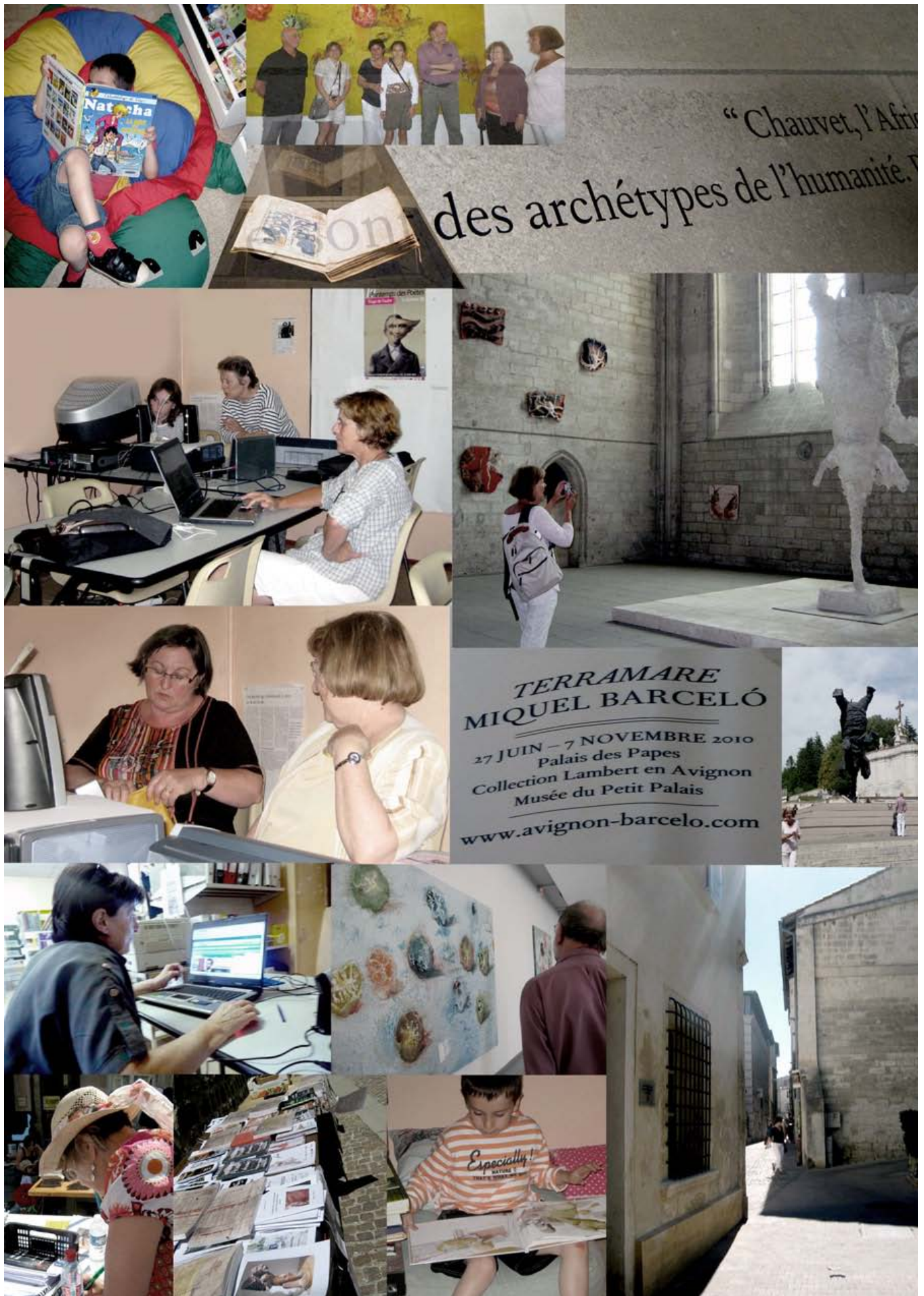
De la bibliothèque et du PAPI aux expositions Barcelo d'Avignon en passant par les présentations de livres, curiosité, apprentissages et partages...