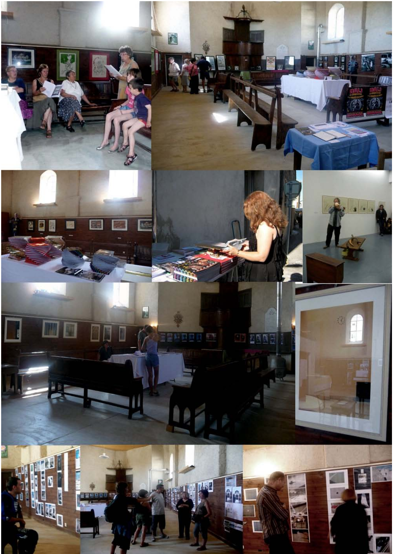
Deux expositions majeures aux Baraques : Dali et Couturier . Plus de 400 visites. Restitution très appréciée du stage d'Arles. Et Blaine à Privas !