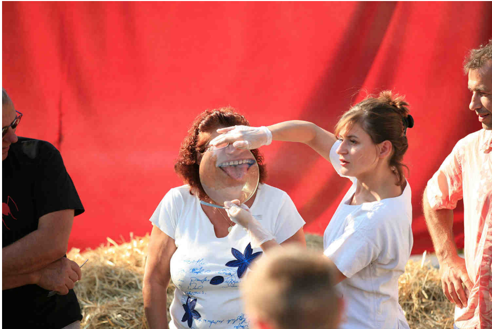
"Le pansage de la langue"