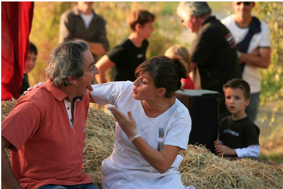
"Le pansage de la langue"