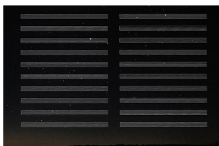
Glenda León, Listening to stars , 2010